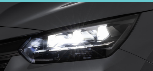
Faróis full LED