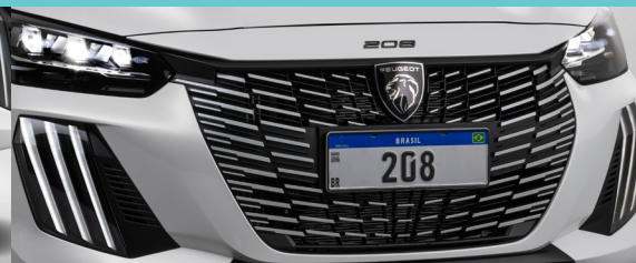
Nova grade na cor do carro