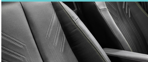
Novos bancos com costuras e detalhes exclusivos