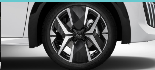
Rodas de liga-leve Diamantadas de 17"