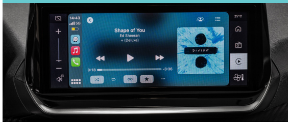
Peugeot i-Connect 10,3" integrada ao painel