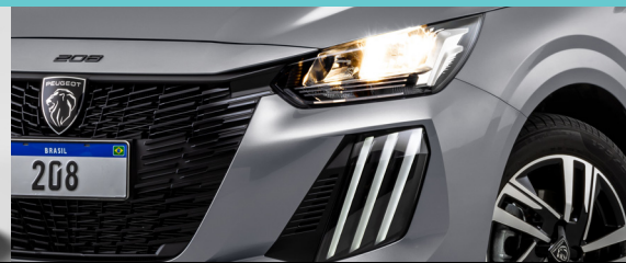
Luzes DRL "Garra de leão" em LED