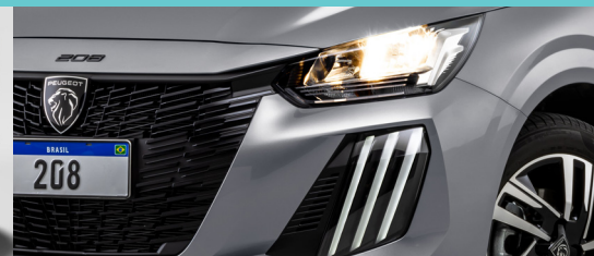
Luzes DRL "Garra de leão" em LED