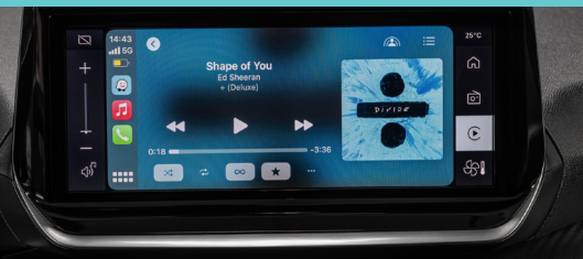
Nova Multimídia Peugeot i-Connect 10,3"