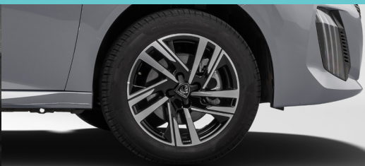
Rodas de liga-leve de 16"