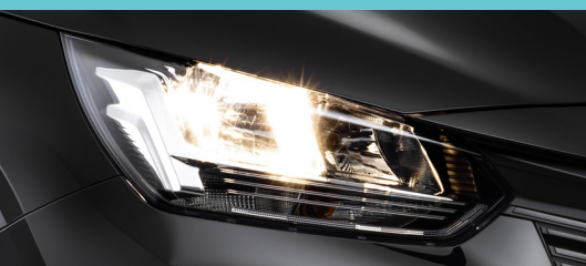
Faróis halógenos + DRL LED garra de leão (pack tech)