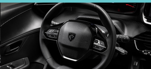
Volante de diâmetro reduzido (Sport Drive)