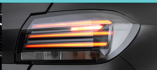
Lanternas traseiras em LED