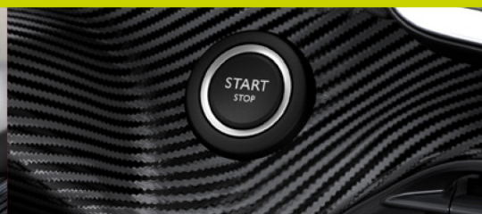
Enter n' Go (Keyless)