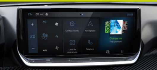
Nova multimídia Peugeot i-Connect Advanced 10,3"