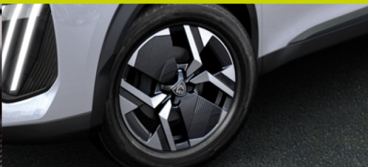
Rodas de liga-leve Diamantadas 17"