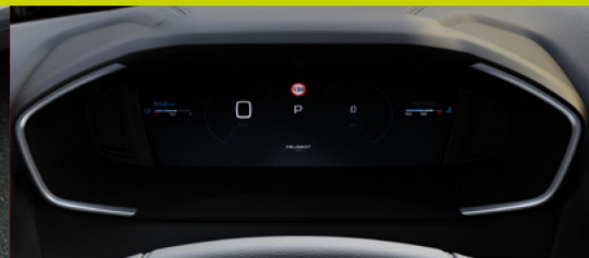
Peugeot i-Cockpit® 2D 10"