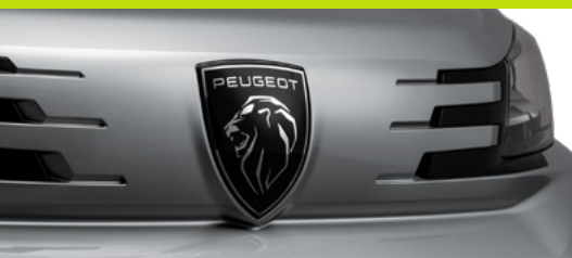
Novos badges e nova grade frontal