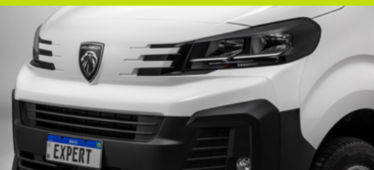
Novos badges e nova grade frontal