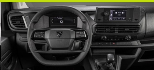
Novo volante com comandos, painel de instrumentos digital e tela touch de 5"