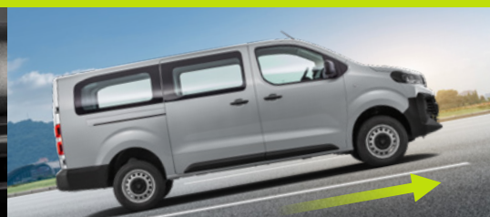
Assistente de partida em rampa