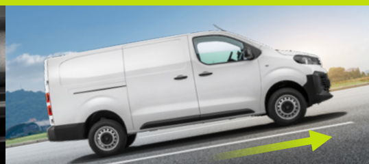
Assistente de partida em rampa